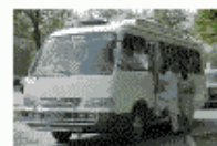
コースター(小型バス) フライングコーチと言われることもあり。 女性は前方の座席に座ります。